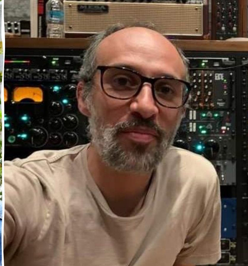
MUSIQUE ORIGINELLE : LEO SOQUI